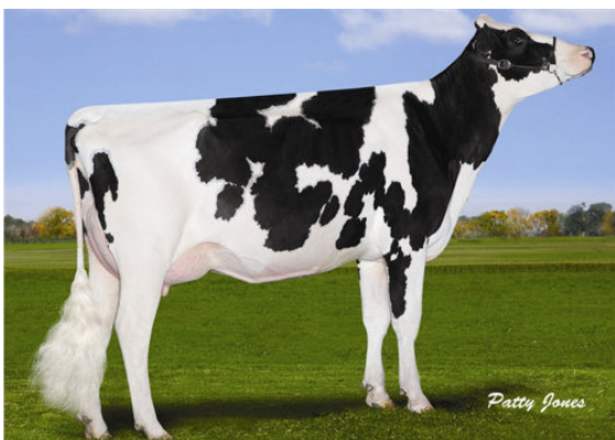
GEN-I-BEQ SNOWMAN SUMMER FIFTH DAM