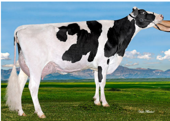
MS SOFIAS DELTA SKY THIRD DAM